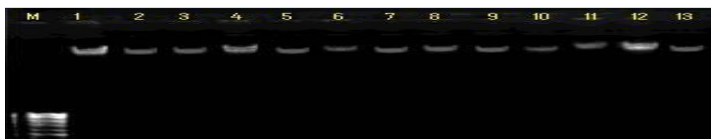
شکل ۱- DNA ژنومی استخراج شده تعدادی از ژنوتیپ‌های گندم Figure 1. Extracted genomic DNA from some wheat genotypes

بررسی کیفیت نمونه‌های DNA استخراج شده با استفاده از ژل آگارز (شکل ۱) و دستگاه پیکودراپ نشان داد که DNAها از کیفیت مطلوبی برخوردارند. آغازگرهای مورد استفاده در مجموع ۶۹ آلل را در تمام ژنوتیپ‌ها، برای هر مکان شناسایی و تکثیر کردند، تعداد آلل تکثیر شده توسط آغازگرها از ۲ آلل (آغازگرهای Xgwm369 و Xcfd40) تا ۵ آلل (آغازگر Xbarc54) متغیر بود. میانگین تعداد آلل ۳/۴۵ آلل در هر مکان ژنی بود و واکنش‌های PCR با استفاده از آغازگرهای SSR قطعاتی را تکثیر کرد که طول آنها بین ۵۰ تا ۳۵۰ جفت باز متغیر بود. آغازگرهای Xcfa2164 و Xbarc54 موجود بر روی کروموزوم 3A و Xbarc148 بر روی کروموزوم 1A در تمام ژنوتیپ‌ها