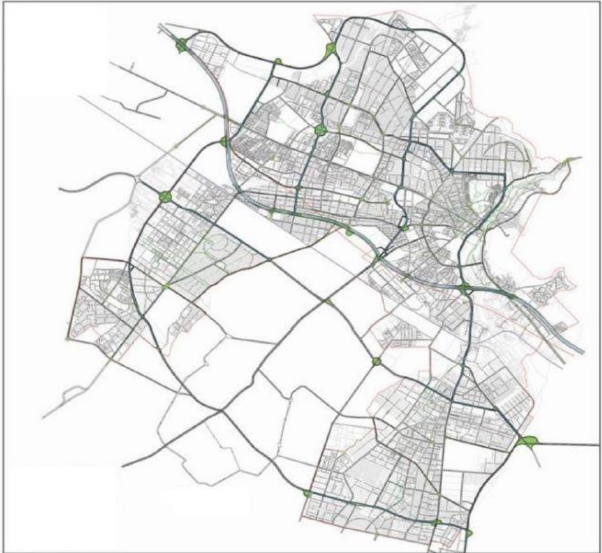
شکل ۱: شبکه معابر درون شهری کرج (آزادراه، شریانی درجه ۱ و ۲)

با در نظر گرفتن تعاریف معابر شهری، لایه های اطلاعاتی معابر اصلی شهر کرج در نرم افزار ARCGIS تعریف و مشخص شد. (شکل ۱)