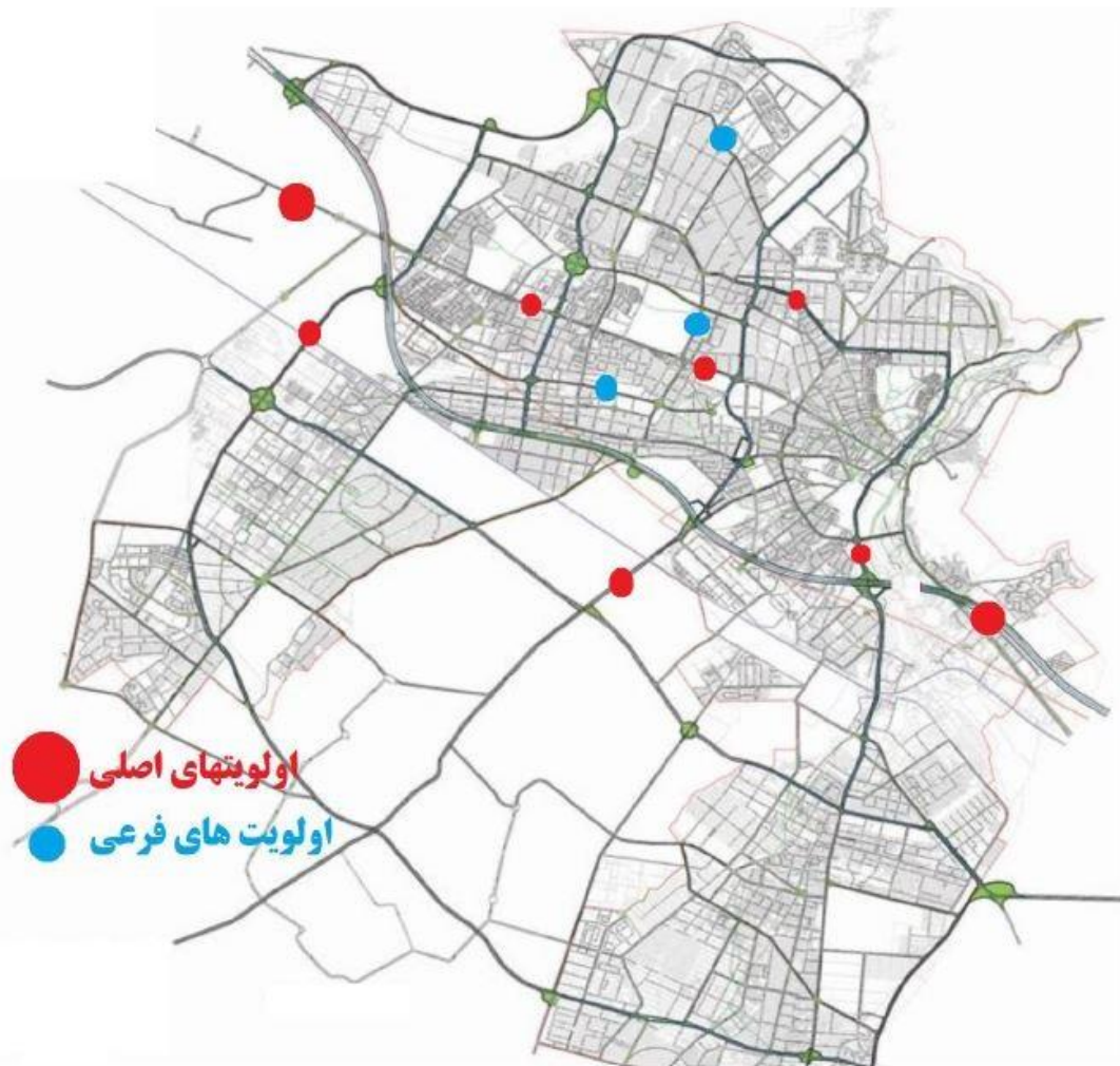
شکل ۳: اولویت بندی محل استقرار تابلوهای VMS براساس پارامترهای موثر